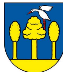
Obrázok 2 Erb obce

Erb obce Uzovské Peklány tvorí v modrom štíte zo zlatej pažite vyrastajúce tri zlaté listnaté stromy, na strednom zľava stojí strieborný bocian v červenej zbroji.