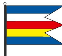
Obrázok 3 Vlajka obce

Vlajka obce Uzovské Peklány pozostáva z piatich pozdĺžnych pruhov vo farbách 1/5 modrá, 1/5 biela, 1/5 červená, 1/5 žltá, 1/5 modrá. Vlajka má pomer strán 2:3 a ukončená je troma cípmi, t.j. dvoma zástrihmi, siahajúcimi do tretiny jej listu.